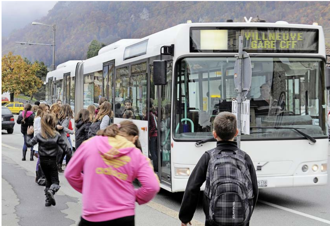
Une septantaine d'élèves de Villeneuve prennent le bus pour se rendre à Roche. CHANTAL DERVEY

Légal et économique... Ces arguments ulcèrent les parents qui déplorent le cynisme des autorités: «On parle de transport d'enfants, pas de soldats! insiste Michael